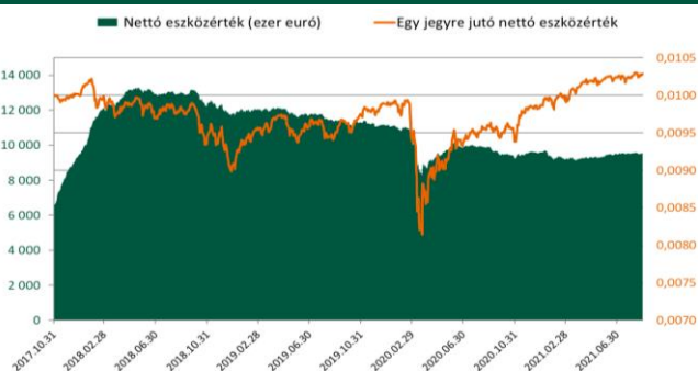
A Részalap jogelődje teljesítményének figyelembevételével.