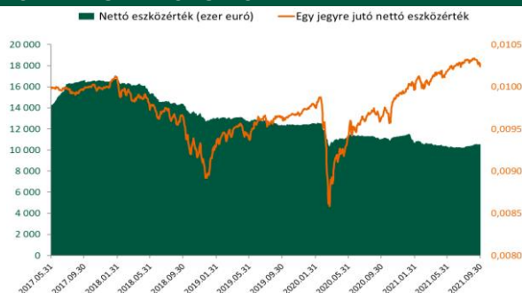
A Részalap jogelődje teljesítményének figyelembevételével.