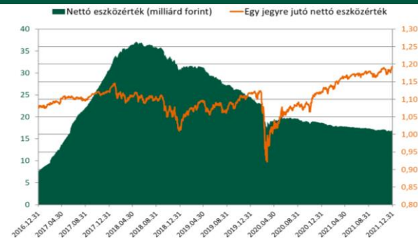
A Részalap jogelődje teljesítményének figyelembevételével.