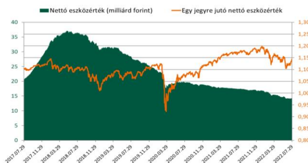
A Részalap jogelődje teljesítményének figyelembevételével.