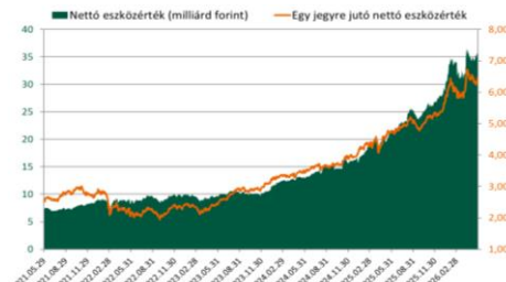
A Részalap jogelődje teljesítményének figyelembevételével.